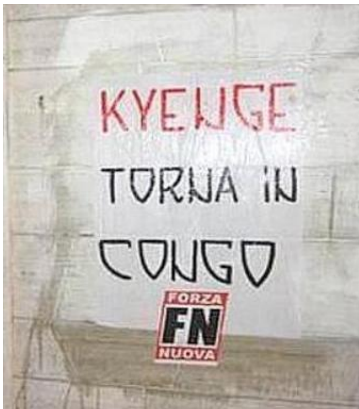
5- Mur tagué signé Forza Nuova;