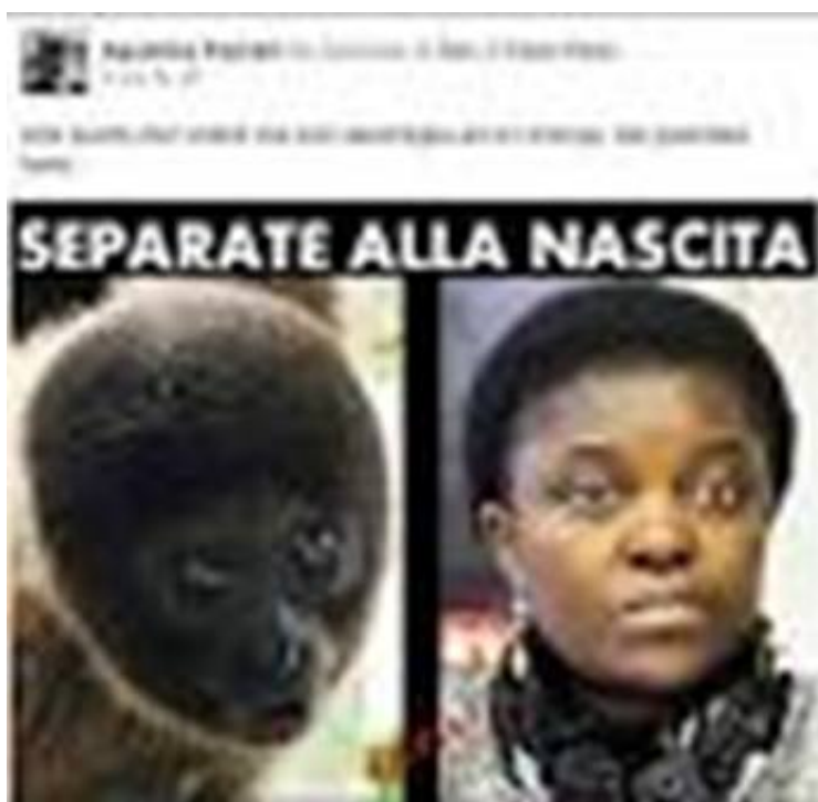
7- Photomontage signé Roberto Calderoli.