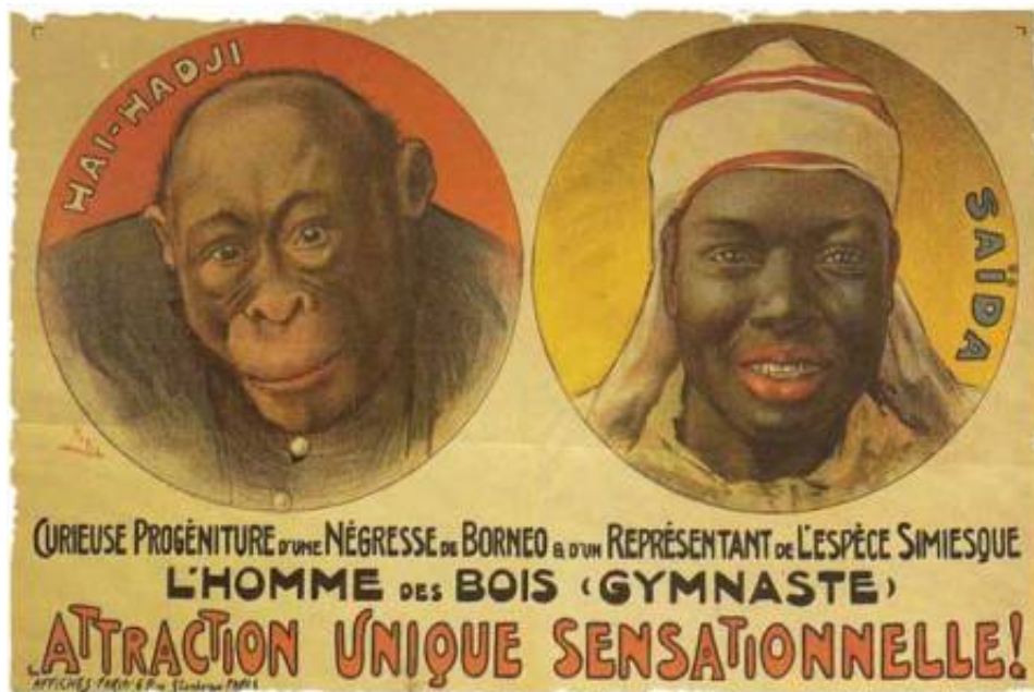
3- Affiche de 1931 invitant à visiter un "zoo humain" au Jardin d'acclimatation de Paris.