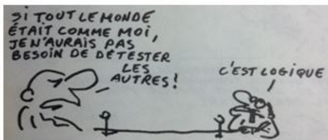
Wolinski, Les Français me font rire , p. 5.

Les Français me font rire est un album de Georges Wolinski 1 que j'ai lu il y a plusieurs années et qui m'avait beaucoup amusé. L'album a paru en 1975 aux Éditions du Square, dans la « Série bête et méchante ». La mort dramatique du dessinateur, assassiné le 7 janvier 2015, dans l'attentat contre Charlie Hebdo à Paris, m'a poussé à relire ce texte pour voir qui était le Wolinski des années soixante-dix et quel est le regard que ce dessinateur amusé et amusant a porté sur la France et les Français, regard qui constitue un témoignage précieux pour comprendre l'évolution des mœurs de la société française à la suite de Mai 1968.