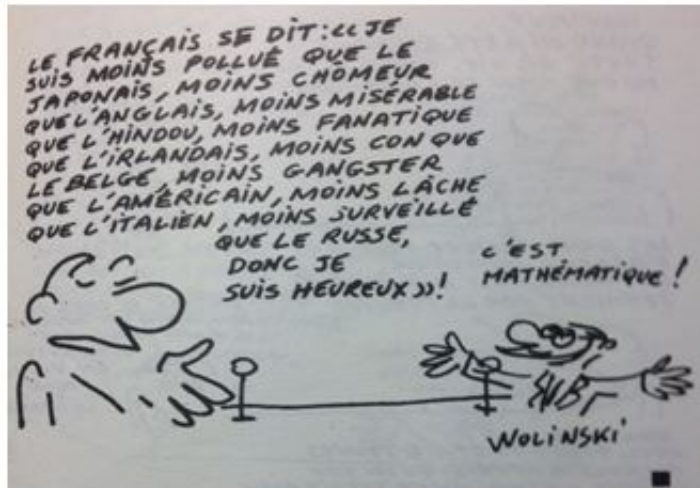
Les Français me font rire , « La manie des grandeurs », p. 89.