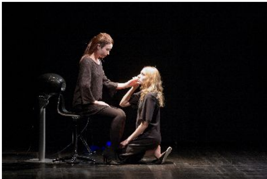
Fig. 2 Portrait du robot Géminoïde F, représentant une jeune femme de 25 ans.

créé sa première pièce avec deux robots de ce type intitulée Hataraku Watashi (I Am a Worker) en 2008. Le véritable rapprochement entre l'équipe de création et le laboratoire commence néanmoins lorsque Ishiguro propose à Hirata de travailler avec un robot androïde version féminine, nommé Géminoïde F (Fig. 2).