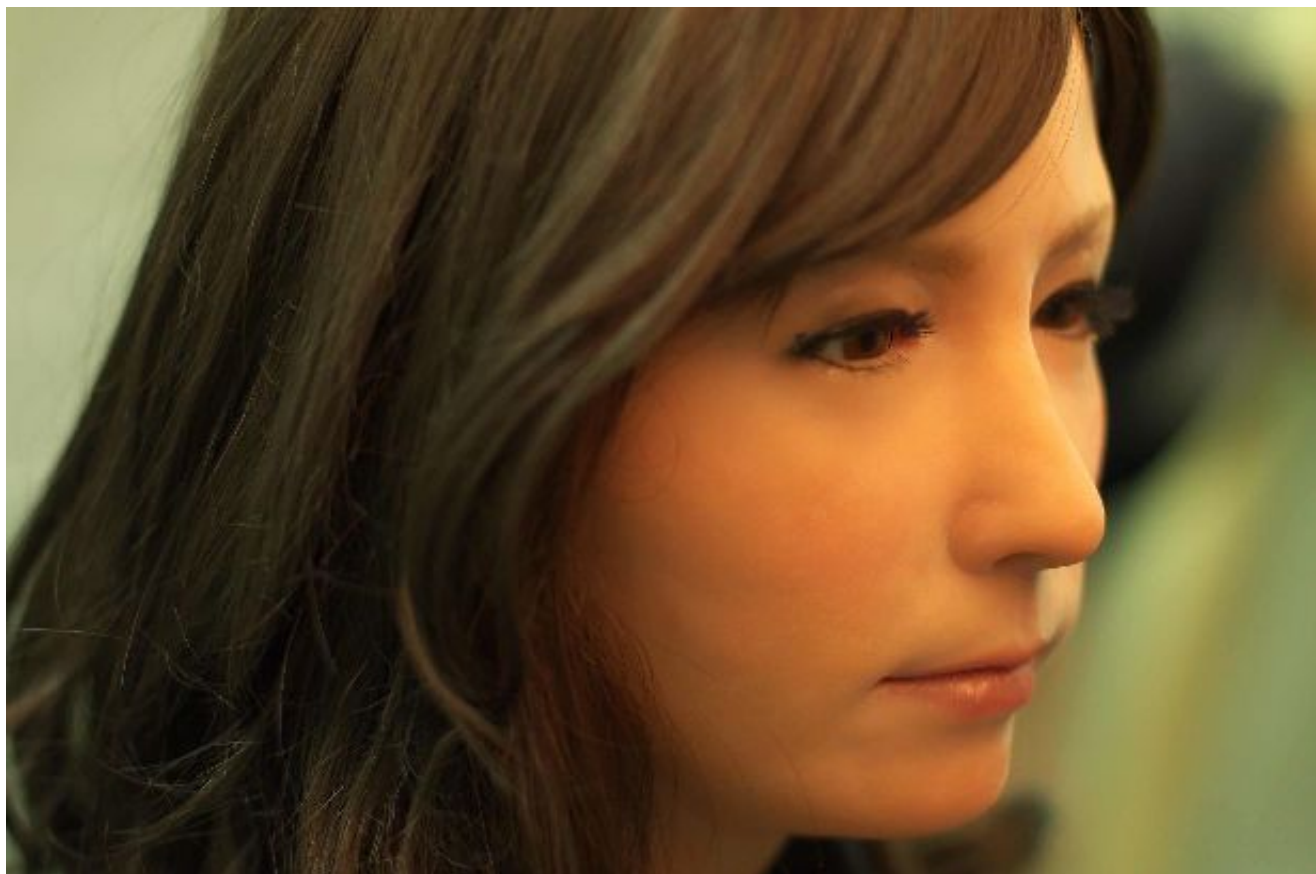
Fig. 1 Spectacle « Sayonara » mis en scène par Oriza Hirata en 2010.