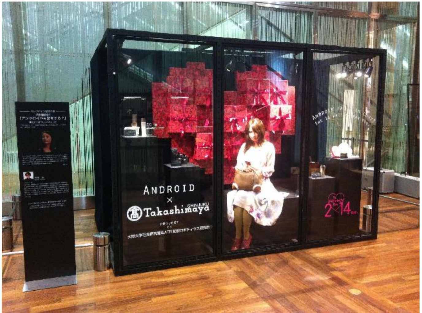
Fig. 6 L'androïde exposé au grand magasin Takashimaya à Tokyo en 2012.