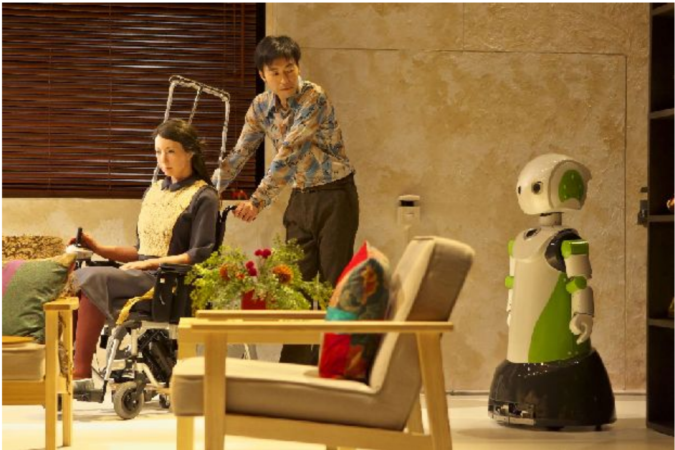
Fig. 3 Spectacle « Les Trois sœurs version androïde » présenté au festival d'Automne en 2012.