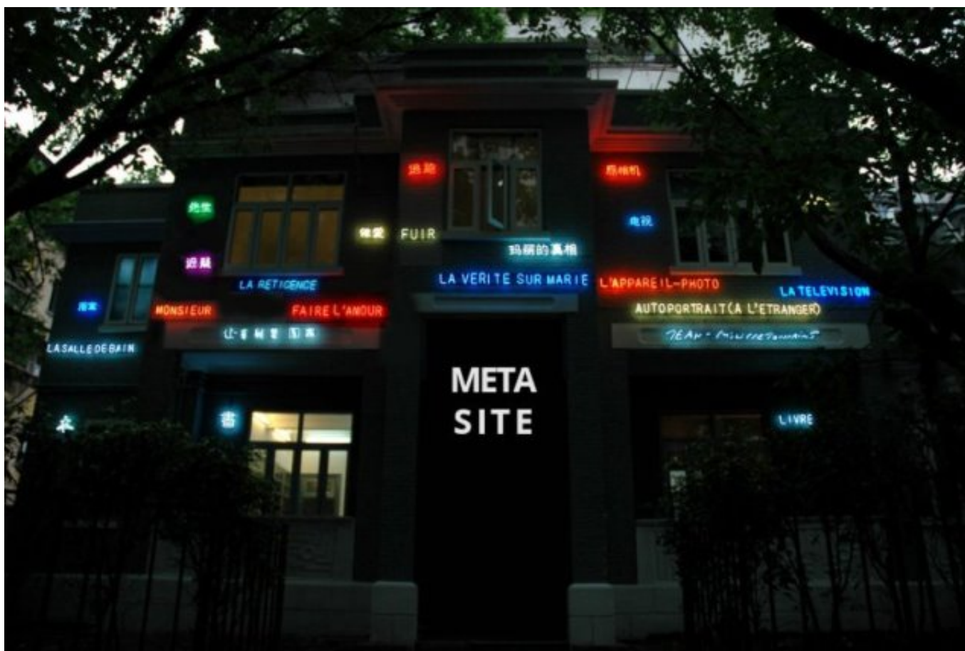
Fig. 2 La Bibliothèque de Canton © Jean-Philippe Toussaint.